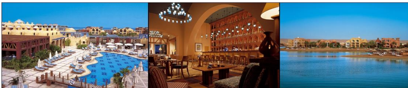
Sheraton Miramar El Gouna