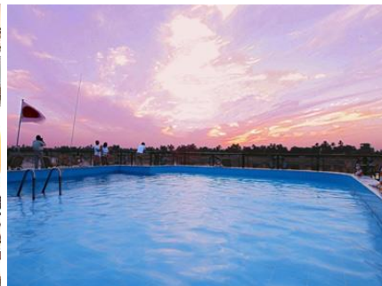
HS Jaz Crown Jewel